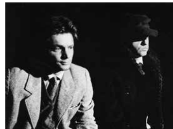
ŽENA V ČERNÉM

ZH: Mám úžasnou ženu a skvělého syna. Co víc si přát! Snad jenom plný košík voňavých hříbků.